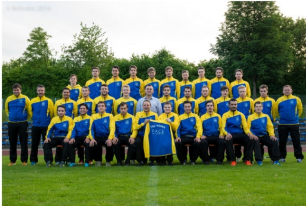
Quelle: http://www.tsvpoing-fussball.de/index.php/herren/1-mannschaft 19.05.16